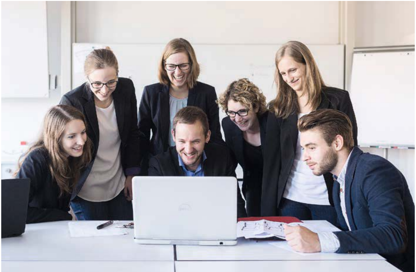
Fallstudiengruppe im 6. Semester